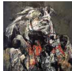
Mostafizul Haque モスタフィズル・ハク