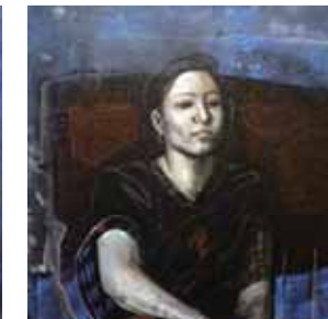
Sheikh Afzal Hossain シェイク・アフザル・ホサイン