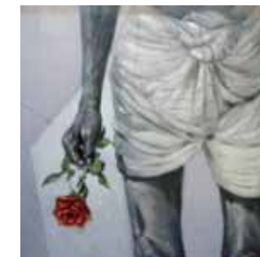
Kamal Uddin カマル・ウディン