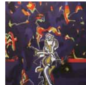
Abdus Sattar Toufiq アブダス・サッタール・トウフィク