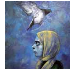
Sahid Kazi サヒド・カジ