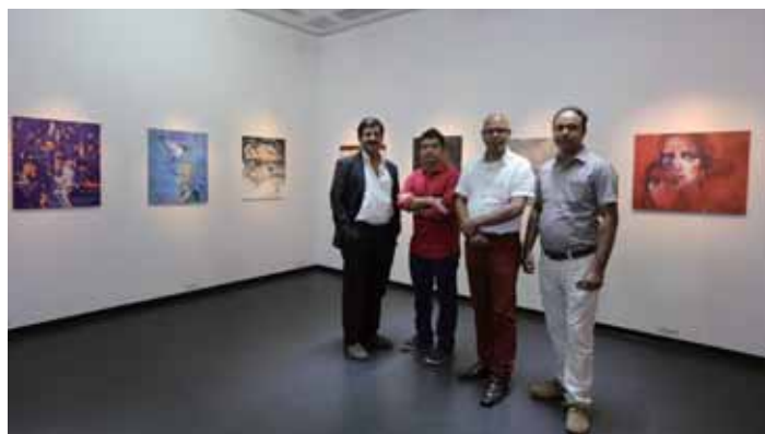
日本に来られたダッカ大学絵画科教授の皆さん

今回の展覧会は、バンダレイシユにあるダッカ大学の絵画科で教えておられる教授の方々14人によるグループ展です。 作品は一人につき2~3点出品され、日本とはまた違った独自の色使いや表現などが見られる国際情緒溢れるものが並びました。 宗教的なもの、戦争などかつての国内情勢を描いたもの、建築物や電線等が密集する近代的なもの、人物、動物、文化・・・それぞれテーマや表現方法様々ですが、その中で今回目立っていたのは人物や動物などをモチーフにしたものが多く登場していたことです。特に人物のものは、描かれた人の存在感や意思などが強く感じられるメッセージ性の高いもので、とても印象的でした。 教授達の作品を眺めていると、「この方達に教わっている生徒さん達の作品はどんなものだろう」「バンダレイシユはどんな国だろう」と様々な空想が広がってきます。作品を通してその方達の考えや、育った国の環境や文化などたくさん感じ、知ることの出来る展覧会でした。