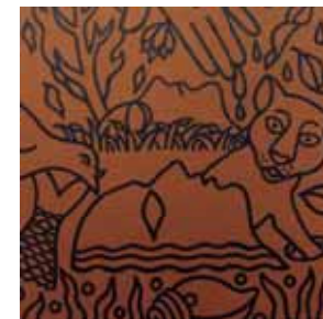
Shishir Bhattacharjee シシル・バッターチャージー